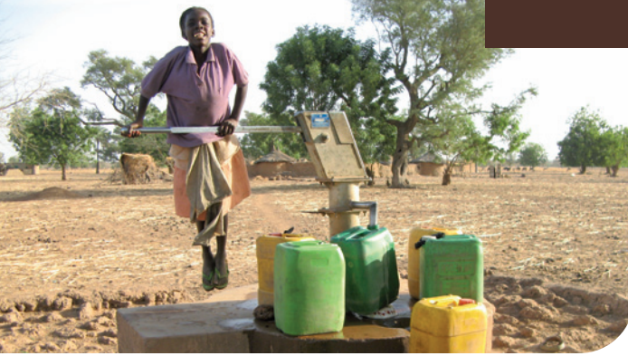
Illustration du suivi-évaluation des demandes de raccordement au réseau d'eau afin d'apprécier l'efficacité des campagnes d'information.